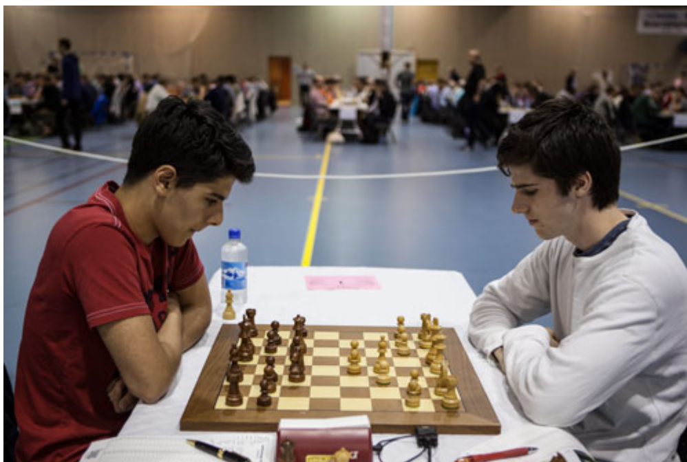
Det står mellom disse to.